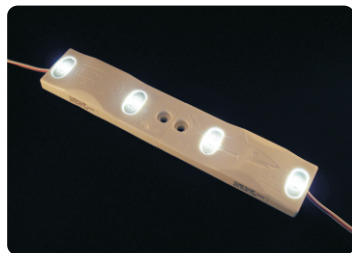
Einzel-Modul wie geliefert