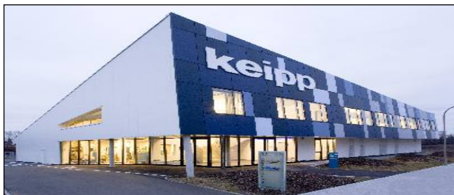
1.000 m 2 Produktionsfläche