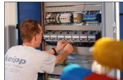
mehr als 60 Facharbeiter bei keipp